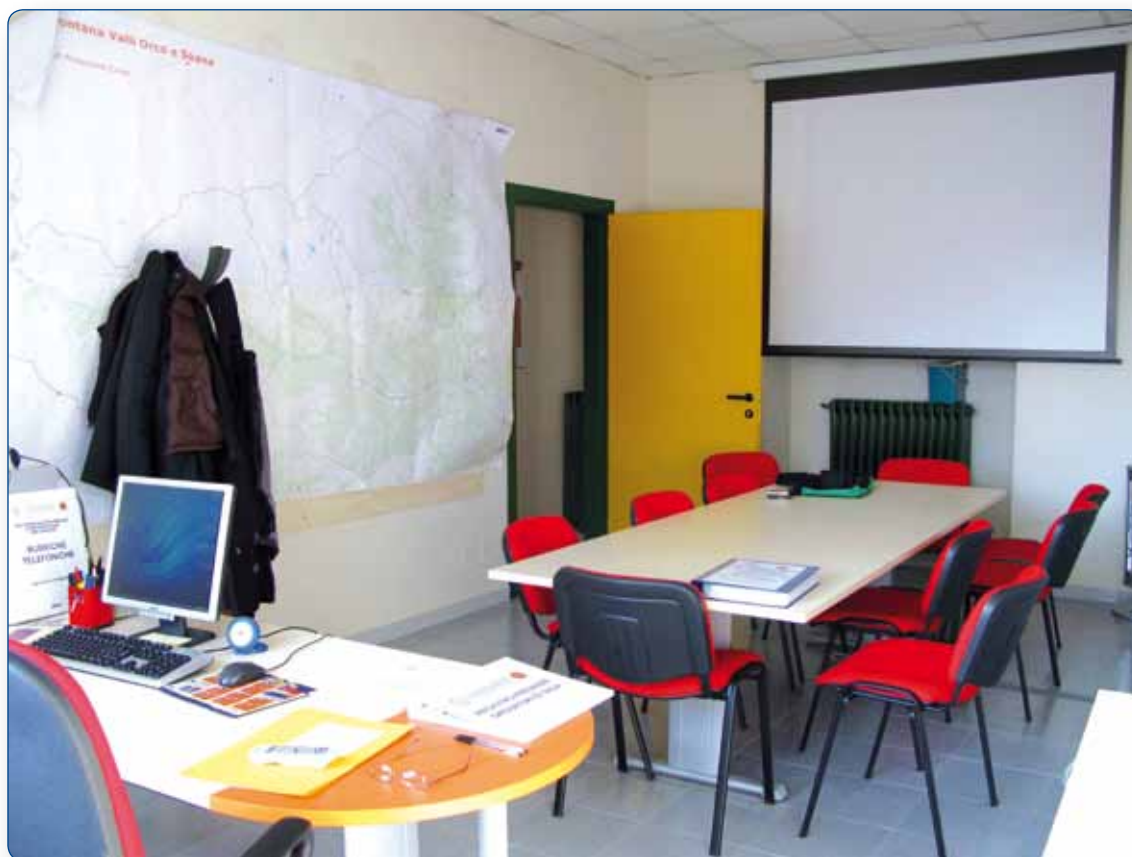
UNITÀ DI CRISI